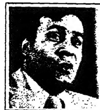
صادق قطب زاده وزير الخارجية

في الوقت الذي اعلن فيه الزعماء في ايران عن استيائهم البالغ لدى توجه القناصل السابق الى مصر في الآونة الاخيرة اعرب وزير الخارجية صادق قطب زاده عن تفاؤله بشأن قرب انتهاء الأزمة. وقد تحدث صادق قطب زاده عن هذا الموضوع في مقابلة اجرتها معه مجلة التايم الامريكية.